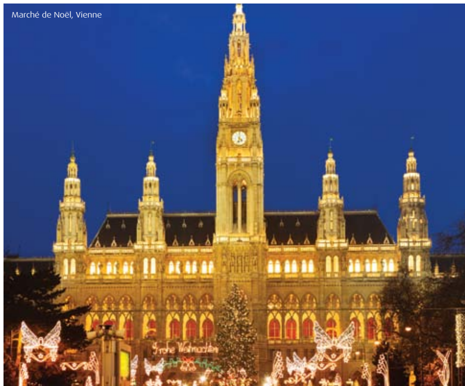
Marché de Noël, Vienne