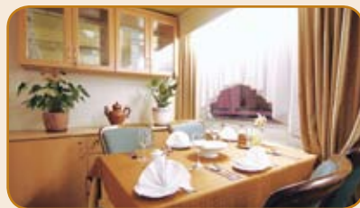
CABINE PONT PRINCIPAL ▶