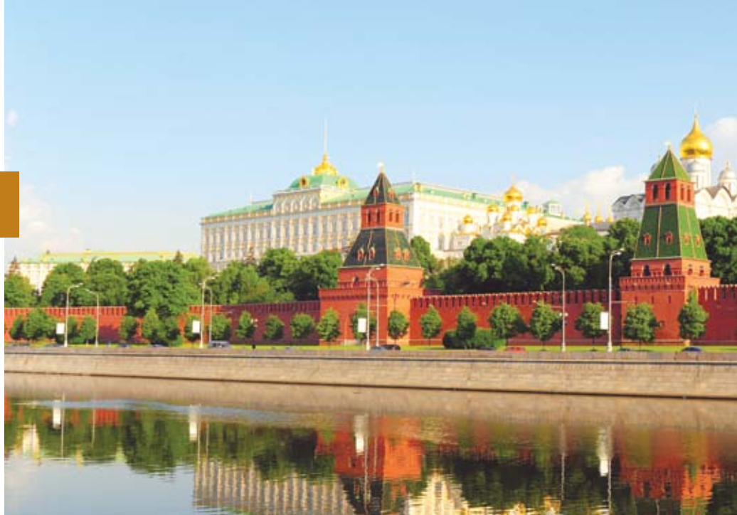
Jour 3 · Visite guidée du Kremlin, Moscou