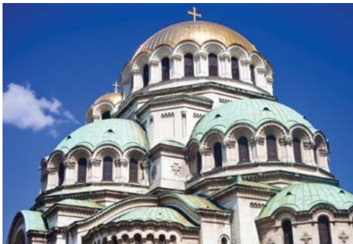
Cathédrale Alexandre Nevski