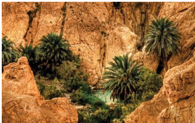
Oasis montagneux de Chebika