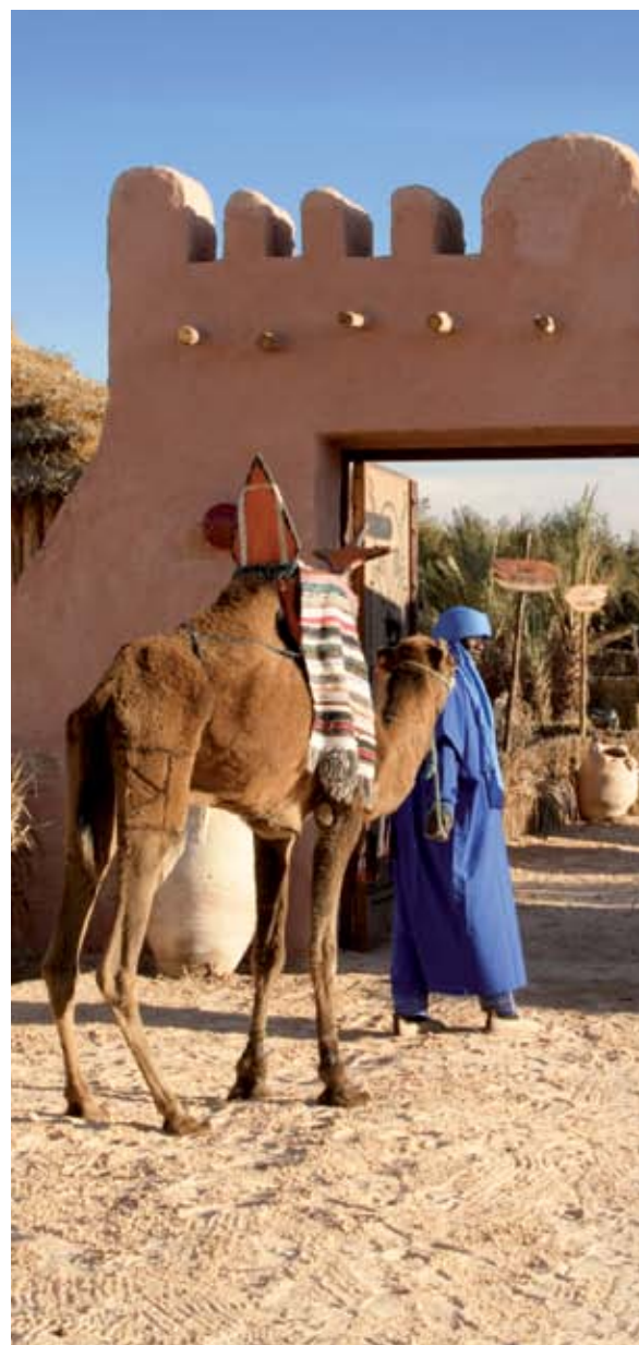
Le campement Zaafrane

Supplément pour départ de : Québec + 80, Bagotville + 215