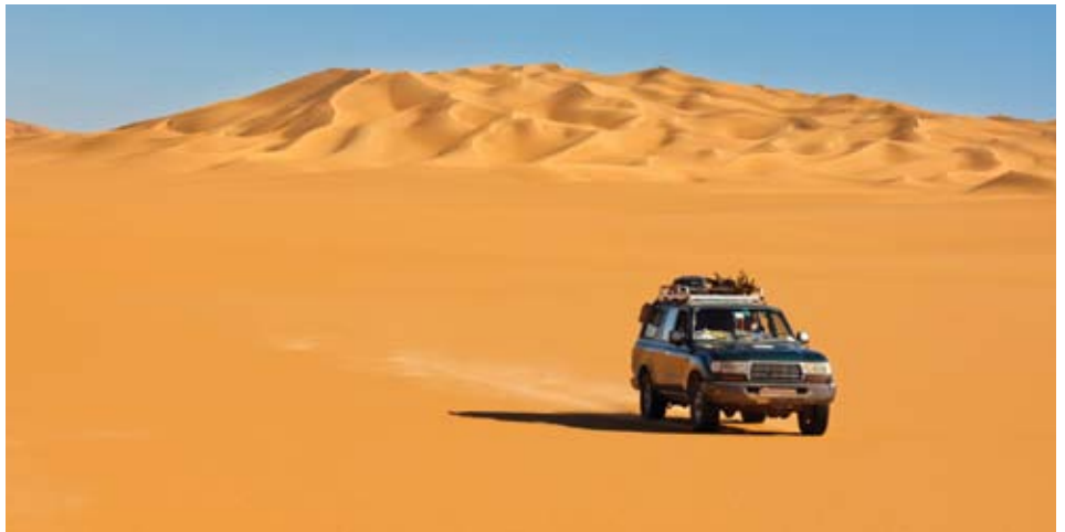
Circuit en 4x4 dans le sud tunisien

Circuit en 4x4 incluant une nuit sous la tente berbère Maximum 4 voyageurs par véhicule