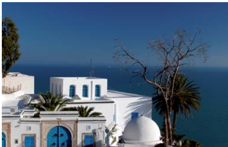
Sidi Bou Said