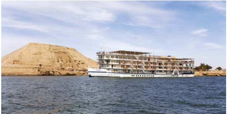
Le MS Prince Abbas à l'approche du Temple de Ramsès II

En plus de découvrir Le Caire et ses merveilles dans la Basse Égypte, vous aurez le privilège d'explorer la Haute Égypte lors de croisières à partir de Louxor vers Assouan, ainsi qu'au cœur de la Nubie, du temple légendaire d'Abou Simbel à Assouan. Ce programme très complet s'adresse à ceux qui veulent voir l'Égypte dans toute sa splendeur.